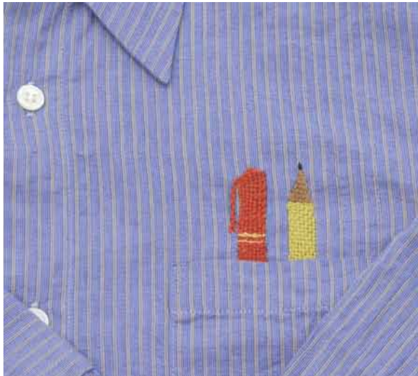
デザイン、制作 / sui:ti