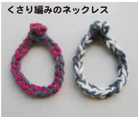
くさり編みのネックレス