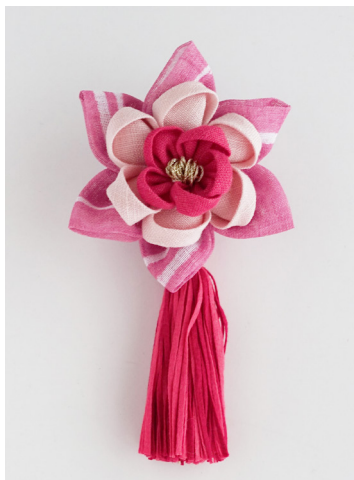
デザイン/ パフェプロジェクト東京・横浜 竹内友美

※つまみ細工プレート、タッセルメーカーの使い方は、商品付属の説明書をご覧ください。