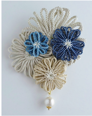
デザイン/ パフェプロジェクト東京・横浜 竹内友美

※花あみルーム<ミニ>、花あみルームの使い方は、商品付属の説明書をご覧ください。