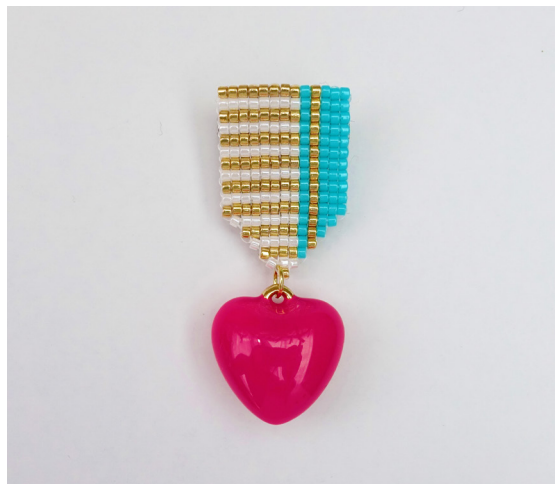
デザイン/パフェプロジェクト東京 星 亜希子