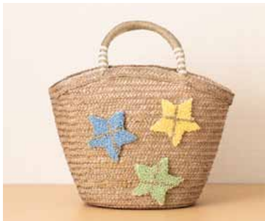
デザイン/パフェプロジェクト東京 永沼より子