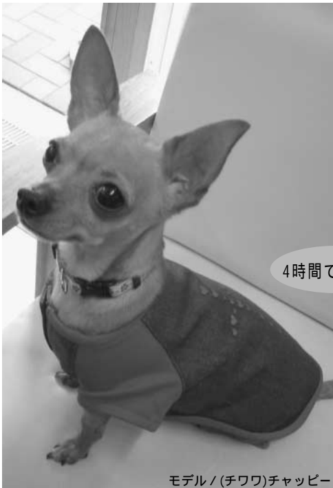
モデル / (チワワ)チャッピー