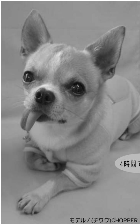
モデル / (チワワ)CHOPPER