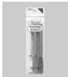
チャコペル®短3本セット