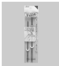
スピードひも通し(長・短2本セット)