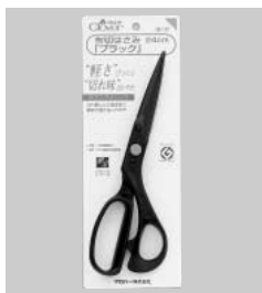
布切はさみ「ブラック」24cm