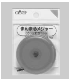
まんまるメジャー