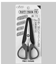
カットワークはさみ 115