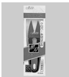
糸切はさみ「ブラック」(黒刃)