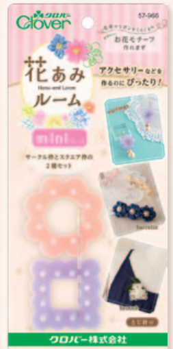
※パッケージはイメージです