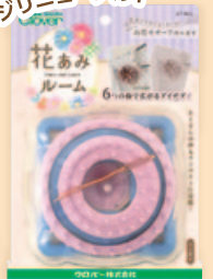
※パッケージはイメージです