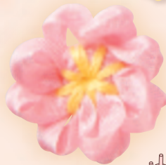
モチーフ作品 実物大 (サークル枠使用)