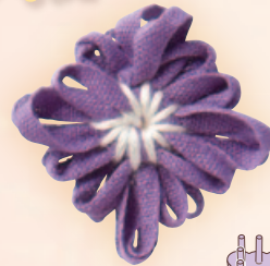
モチーフ作品 実物大 (スクエア枠使用)