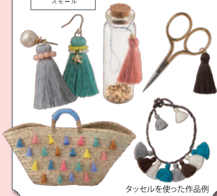
タッセルを使った作品例