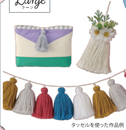
タッセルを使った作品例