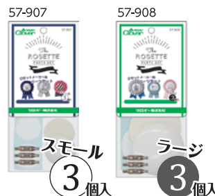
※パッケージはイメージです