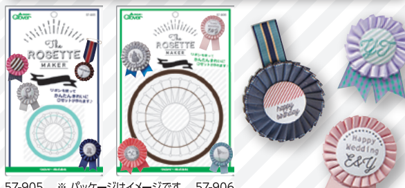
57-905 ※パッケージはイメージです 57-906