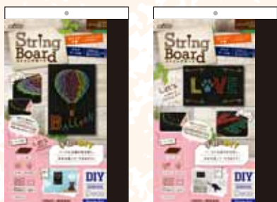
71-124 スtringボード バルーン 71-125 スtringボード ラブ

カラフルなStringボードのDIYをゆっくり楽しめます 制作時間: 約2時間半