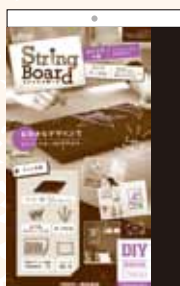
71-126 スtringボード フリーデザイン