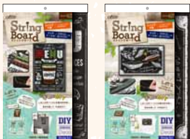
71-122 スtringボード カフェ 71-123 スtringボード フェザー

プリント入りでアートが映える! 早く作れる、しるし付きベース 制作時間: 約1時間