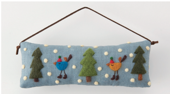
デザイン／高田 とよか