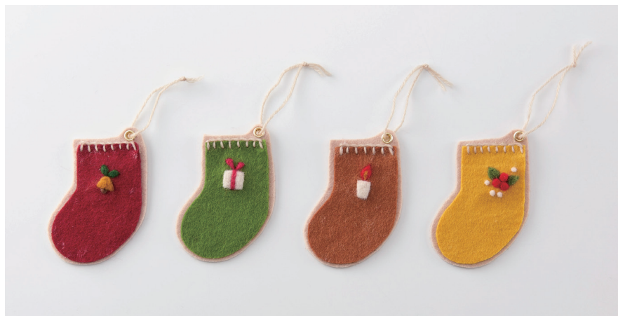
デザイン／高田 とよか