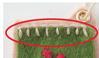
ブランケットステッチ