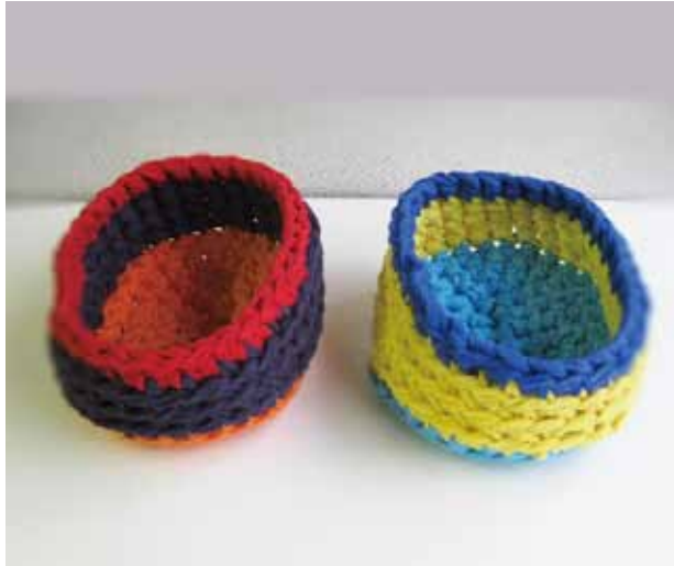
出来上がりサイズ タテ約 13cm × ヨコ約 10cm × 高さ約 5cm