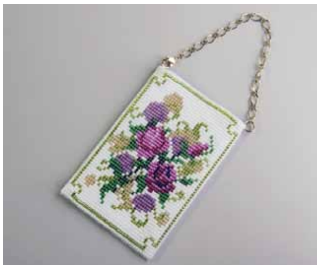
デザイン/さくまなほみ