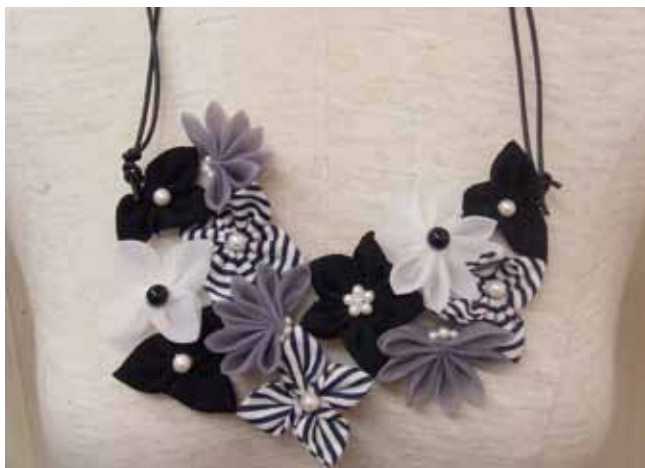
デザイン / 梶 成子