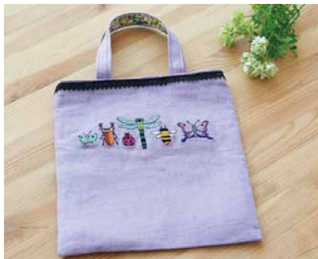
デザイン／足田史佳