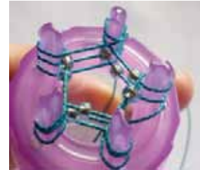
2 周目、3 周目