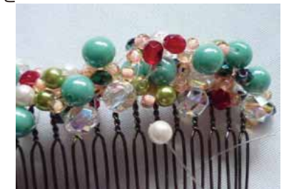
隙間を埋めるようにパールを入れます。

⑦パールを入れながら巻きかかってきたテグスは、コームとブレードの間で玉止めをし、編地を通し大きめのビーズに通してテグスを切る。テグスを切る際には接着剤をつけます。