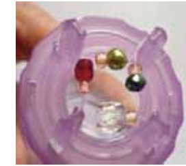
ピンとピンの間に2個ずつビーズを置きます。

②4本ピンヘッドをセットし、基本の編み方リリアン編みA <1ループ>で編みます。テグスの端30cmの残して、作り目を一周巻き、1段目からピンとピンの上にビーズを2個ずつ置きながら編んでいきます。