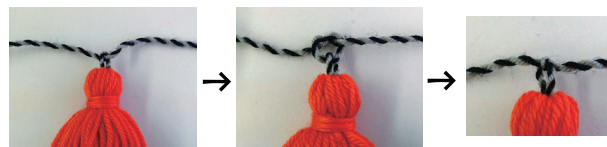
よりひもをタッセルのコードに通し、結ぶ

＜使用道具＞ タッセルメーカー<ラージ> ハンディヤーンツイスター カットワークはさみ115