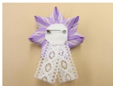
⑮⑩の裏側に貼りつけます。