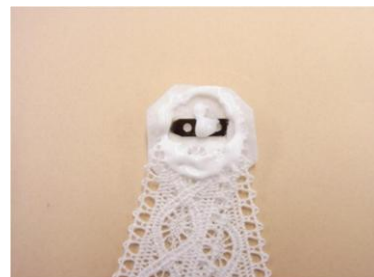
⑭⑬の全体にボンドをつけます。