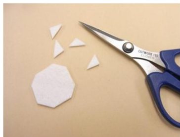
⑪フェルトの角をカットします。