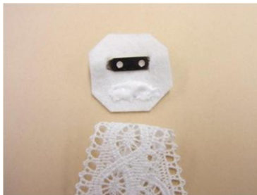
⑬の裏面の下のほうにボンドをつけ、2つに折ったレースをつけます。