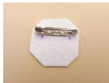
⑫⑪の上にコサージュピンを置き、ピンの3～5mm内側にチャコペンでしるしをつけます。