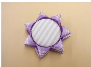
⑩リボンフラワーの真ん中に、⑨をボンドで貼ります。