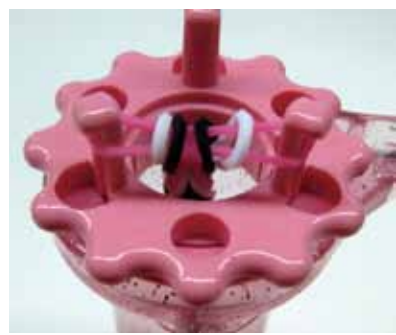
ピンに残った二重の輪も編みます。