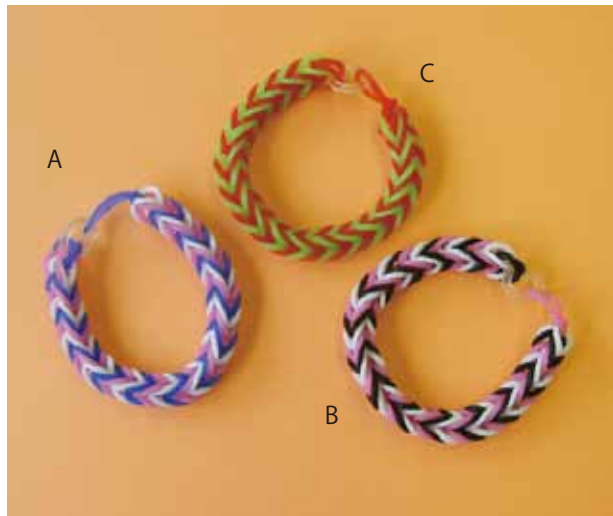
いろいろな配色で作ると楽しいですよ。 AとBは3色、Cは2色で編んでいます。