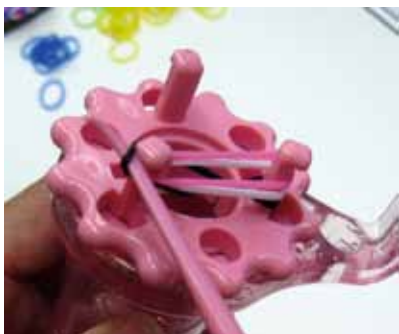
一つ目の輪をすくって上二つの輪にかぶせます。