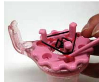
つぎからは、写真のようにねじらず輪をかけ、ひとつ掛けるごとに編みます。