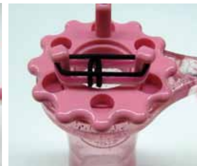
次の輪をかけ、一番下の輪を被せます。