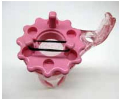
輪を写真のようにかけます。