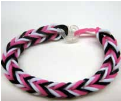
編み始めとクリップでつないでできあがり。