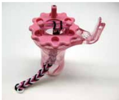
同じようにして36個編みます。