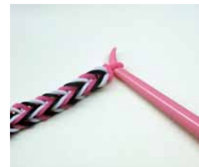
二つ残った目は、片方を被せて一目にします。