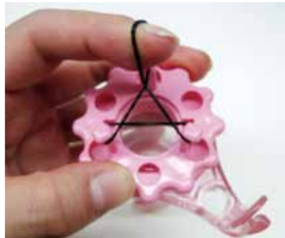
手前の部分をひっぱってねじり、奥のピンにかけます。