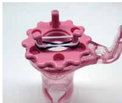
二つ目と三つ目の輪はそのまま（ねじらずに）かけます。