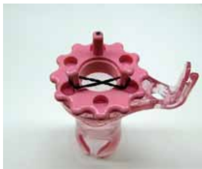
一つ目の輪をねじってかけます。