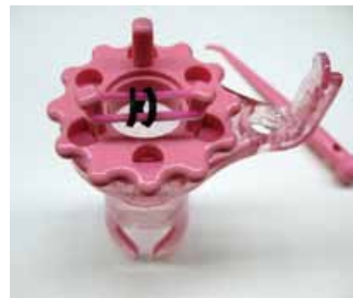
もう片方も同じようにします。