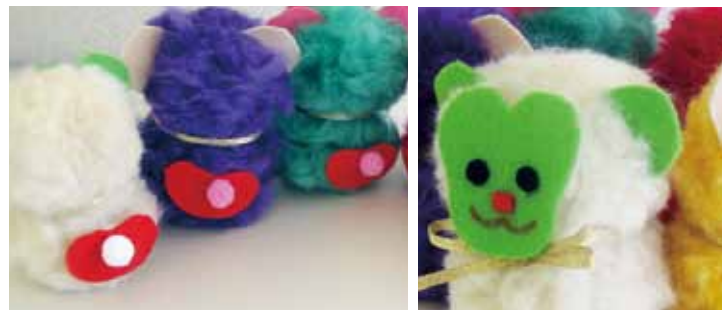
尻尾には梵天を貼ります。

クローバー パフウール好きな色2袋(10g) シートフェルト (顔、耳、目、鼻、おしり用)適宜 梵天(ぼんてん) 1個 3mm幅のリボン 35cm クローバー手芸ボンド<フェルト用> たこ糸