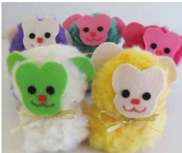
出来上がり寸法 高さ 約 80mm