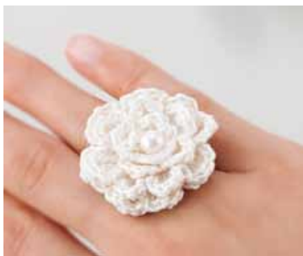
デザイン／梶 成子（カジシゲコ）