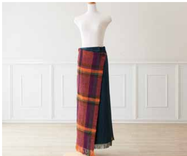
デザイン／曾田よう子