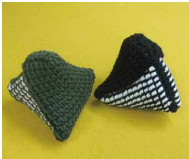
デザイン / sanook