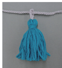
タッセルのコードの 輪にひもを通す