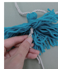
タッセルのコードを 下から引き締める