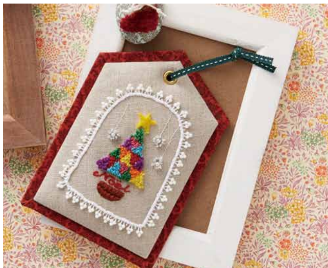
デザイン／高橋眞由美