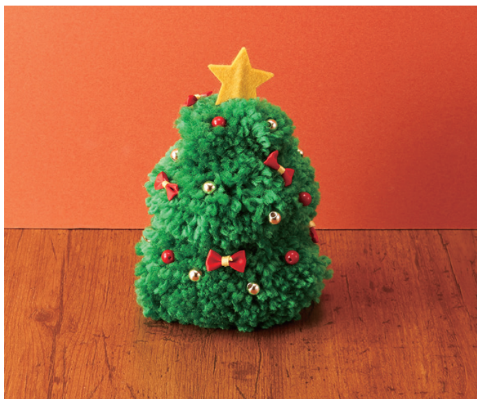
出来上がりサイズ：幅約11cm、奥行き約10cm、高さ約15cm