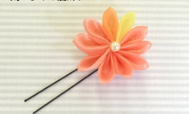
B.剣つまみの髪飾り