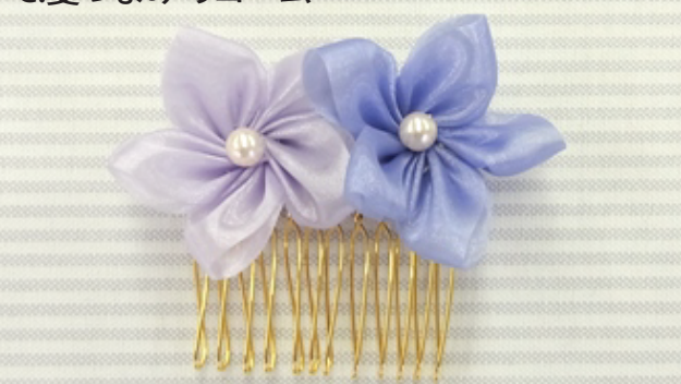
C.菱つまみのコーム