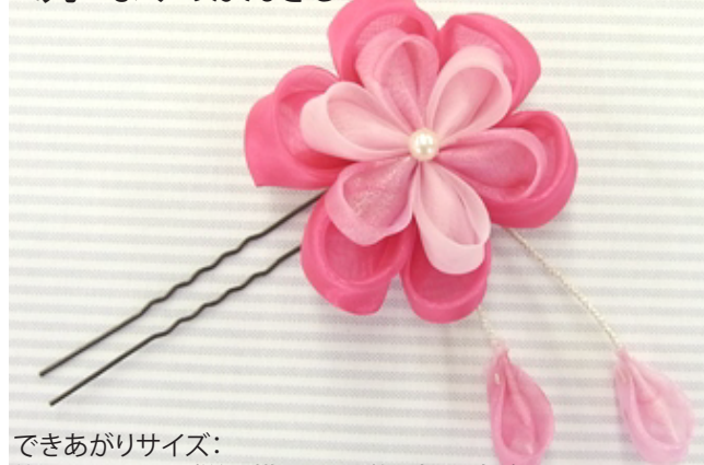
A.丸つまみのかんざし