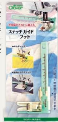
37-189 ステッチガイドフット