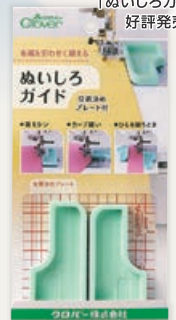
37-188 ぬいしろガイド (位置決めプレート付)