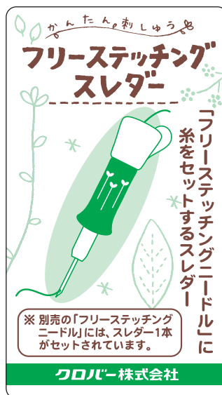
フリーステッチングスレダー パッケージ