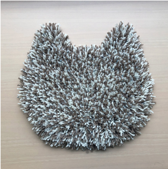
出来上がりサイズ: タテ約29cm×ヨコ約30cm