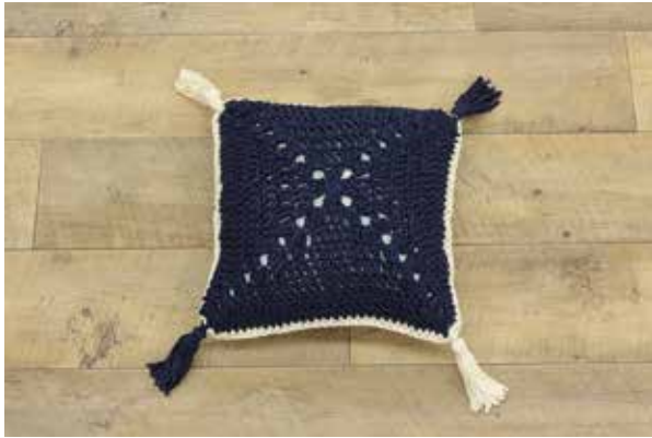
できあがりサイズ 35×35cm のクッション 1 個分