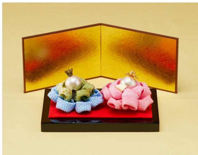
デザイン／杉山智佐