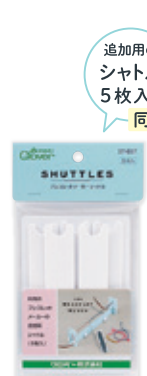
57-657 ブレスレット メーカーシャトル