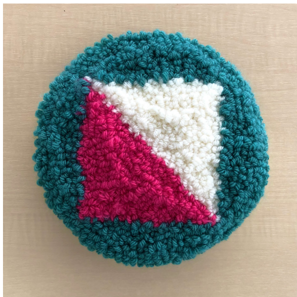
<出来上がりサイズ> 直径約17cm