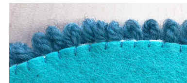
さらにカットしたフェルトを縫い付ける