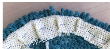
ぬいしろを裏側に折って縫い付ける (表から見えないように)