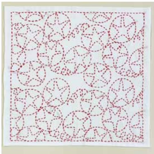
出来上がりサイズ：よこ約 33cm たて約 33cm