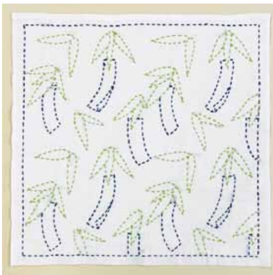
出来上がりサイズ：よこ約 33cm たて約 33cm