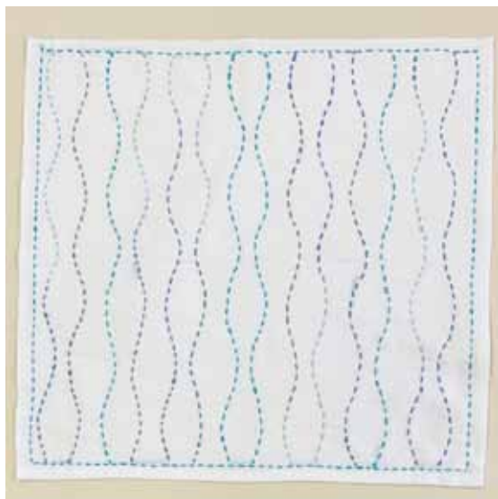
出来上がりサイズ：よこ約 33cm たて約 33cm