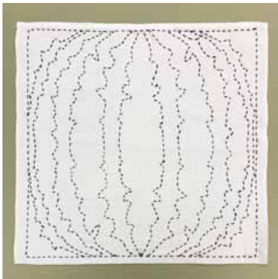
出来上がりサイズ：よこ約 33cm たて約 33cm