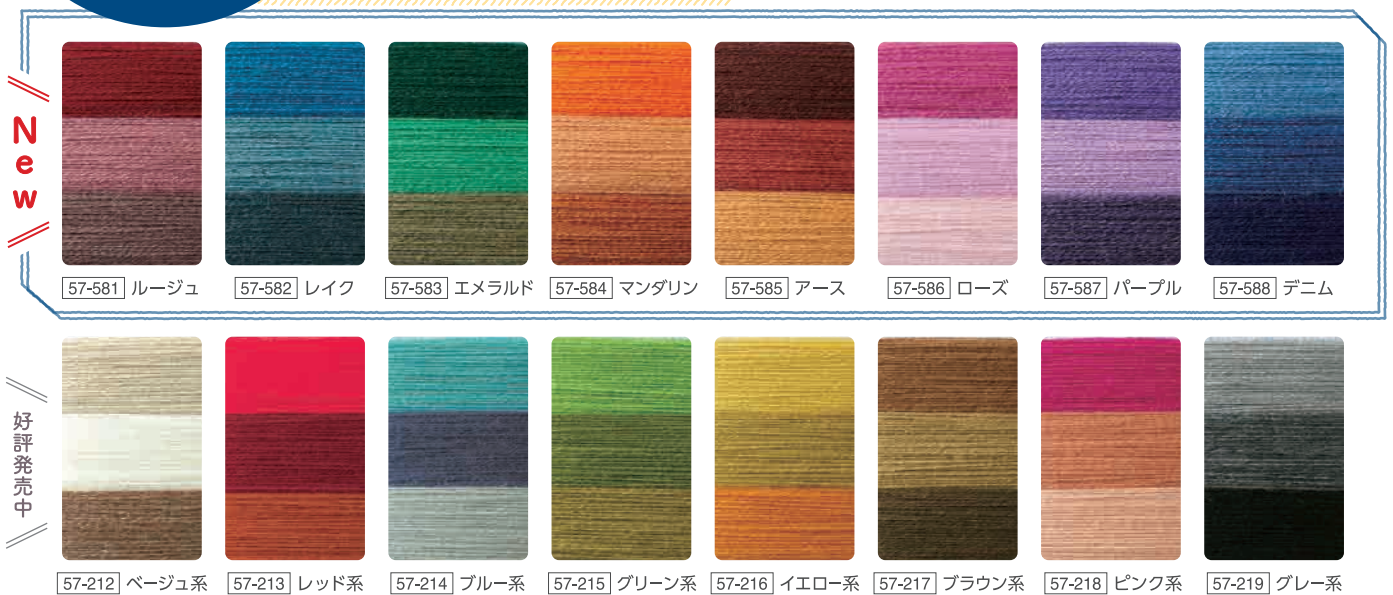
57-581 ルージュ 57-582 レイク 57-583 エメラルド 57-584 マンダリン 57-585 アース 57-586 ローズ 57-587 パープル 57-588 デニム