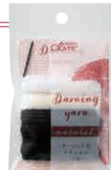
パッケージサイズ (幅×長さ×厚さ) 70×115×10 mm