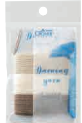
パッケージサイズ (幅×長さ×厚さ) 70×115×8 mm