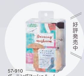
57-910 ダーニングマッシュルーム 〈付け替え式〉