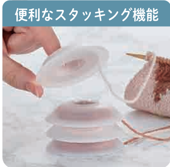
便利なスタッキング機能

程良く糸をホールドし、閉じたまま糸が引き出せます。必要に応じて糸の出し戻しがしやすく、スムーズに編み込みができます。