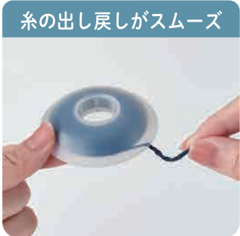
糸の出し戻しがスムーズ

程良く糸をホールドし、閉じたまま糸が引き出せます。必要に応じて糸の出し戻しがしやすく、スムーズに編み込みができます。