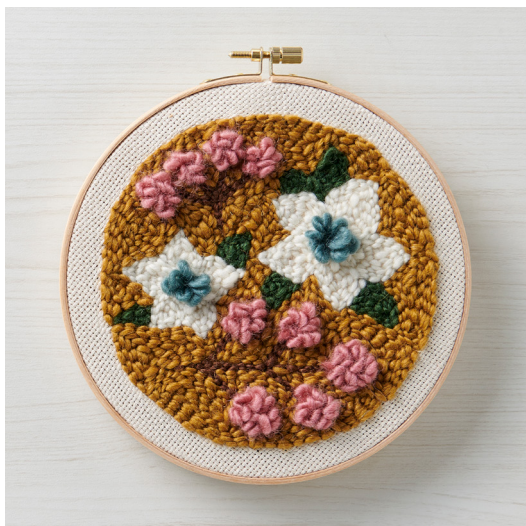
デザイン/WOOLY 井上直美