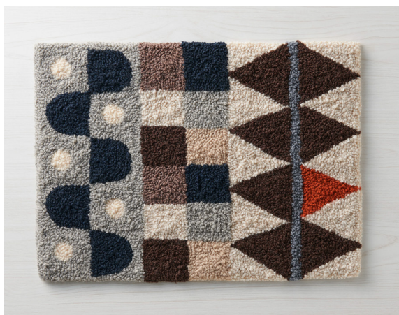
デザイン/WOOLY 井上直美 <出来上がりサイズ> 約40×55cm