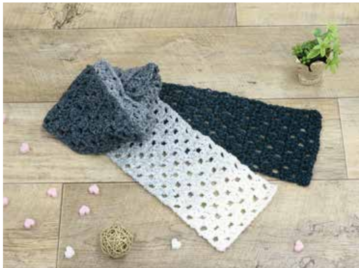
できあがりサイズ 幅:約15cm・長さ約182cm