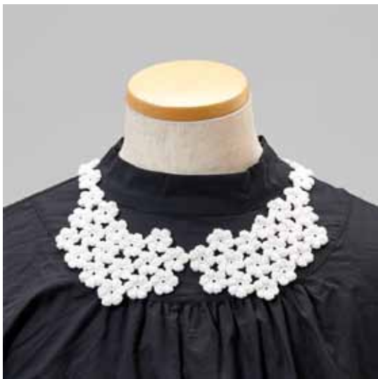
デザイン／梶成子(アトリエseeds) パフェプロジェクト大阪