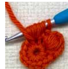
5 目分編みます (10 ループできる)。