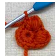
変わり中長編み 5 目 の玉編みができた。