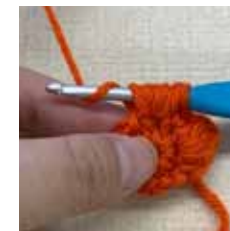
糸をかけて 10 ループ 引き抜く。