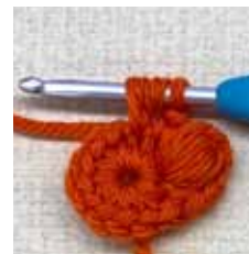
未完成の中長編み。