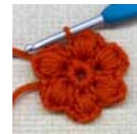
「変わり中長編み 5 目の玉編み」の編み方