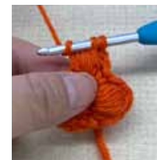
糸をかけて 引き抜きます。