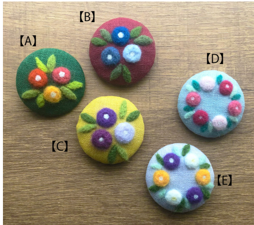
デザイン/クロバー <出来上がりサイズ>直径約4cm