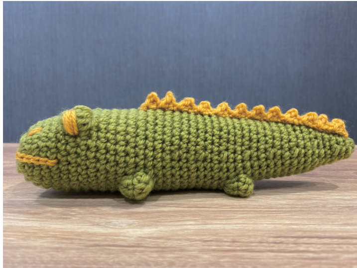
デザイン／エルタデザイン 武田浩子