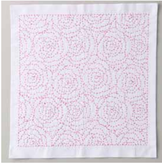
出来上がりサイズ：よこ約 33cm たて約 33cm